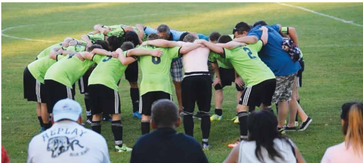
„tradiční týmový pokřik po vítězství 0:1 na půdě Semanína“