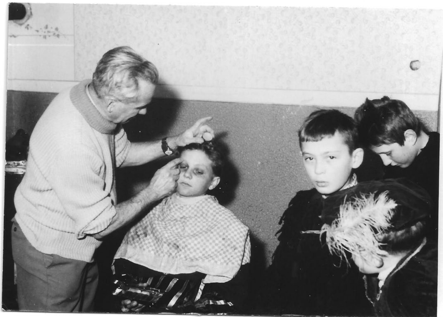
Líčení malých herců pro dětské divadlo nebo besídku, archiv Pavel Papežík