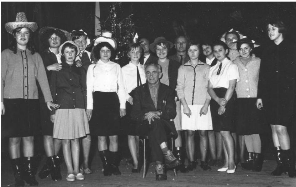
Vánoční představení školy v Kunčíně